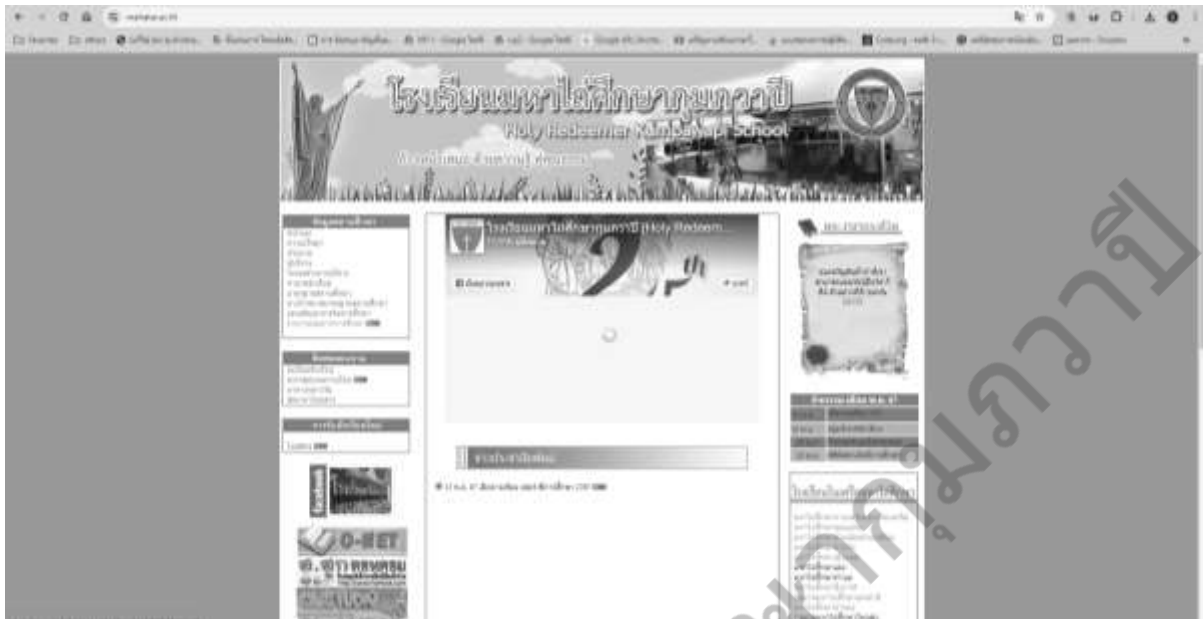
การแสดงผลรายงาน SAR

รูปแบบการเผยแพร่ SAR สู่สาธารณชนรับทราบ ผ่านทางเว็บไซต์โรงเรียน http://www.mahatai.ac.th